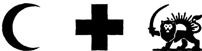
Рис. 2. ОТЛИЧИТЕЛЬНЫЕ ЭМБЛЕМЫ КРАСНАЯ НА БЕЛОМ ФОНЕ

2. В ночное время или при ограниченной видимости отличительная эмблема может освещаться или быть светящейся; она может быть также сделана из материалов, позволяющих различать ее с помощью технических средств обнаружения.