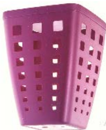
Сл. 1.2 -