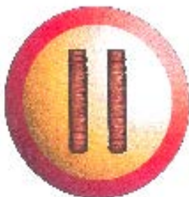
Сл. 1.1 -

Пример за приказе дводимензионалног индустријског дизајна: