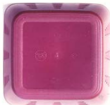
Сл. 1.4 -