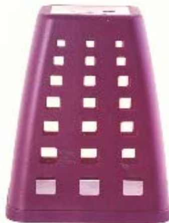
Сл. 1.6 -